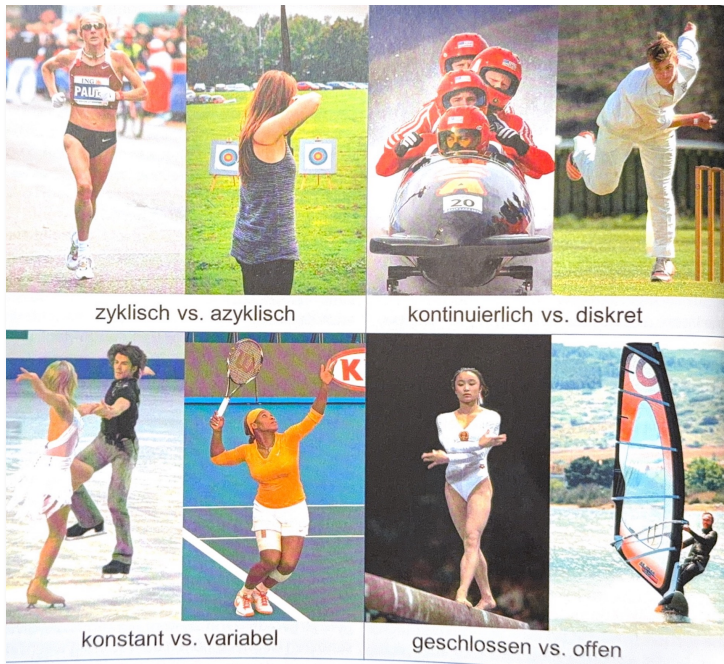
Abbildung aus: Hossner & Künzell. Einführung in die Bewegungswissenschaft (2022). S. 24